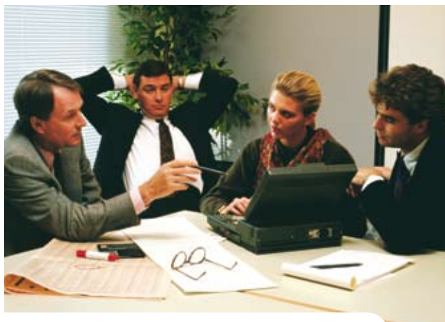
Disposez d'un bureau pour vos rendez-vous professionnels