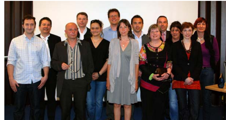
Les lauréats de la 2 e édition des Coups de cœur des Pfil

Les Coups de cœur des Pfil mettent en lumière des créateurs qui ont la volonté d'entreprendre, d'innover et de construire dans la durée. Cette 3 e édition récompensera un florilège des entreprises accompagnées par les 13 Pfil de Lorraine en 2010 et 2011.